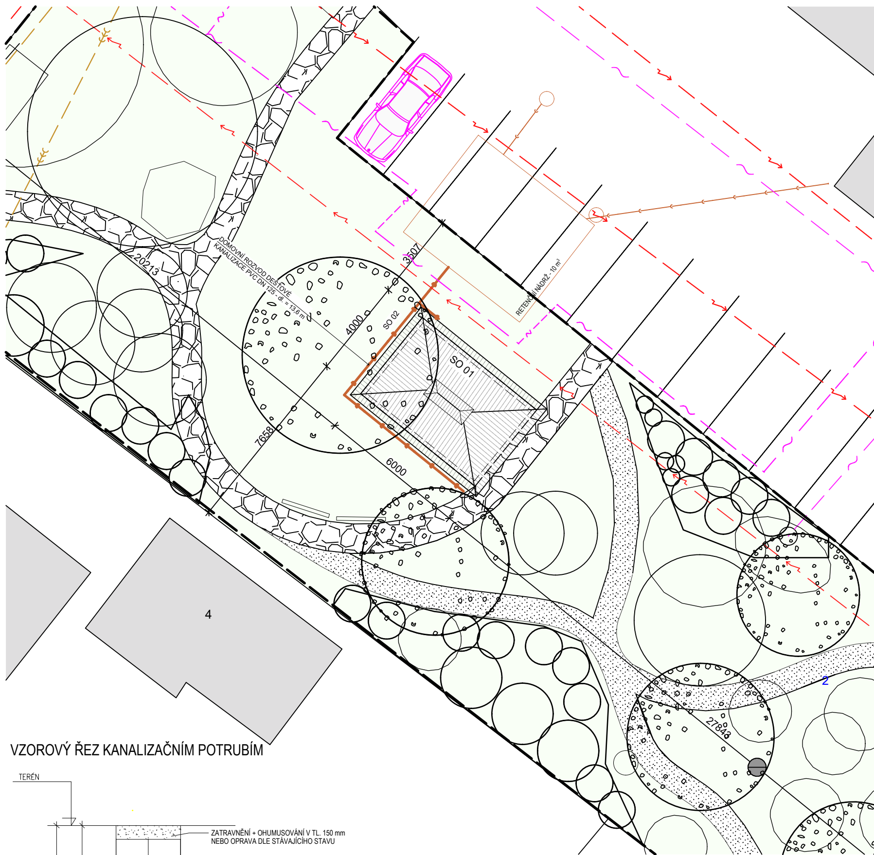
VZOROVÝ ŘEZ KANALIZAČNÍM POTRUBÍM